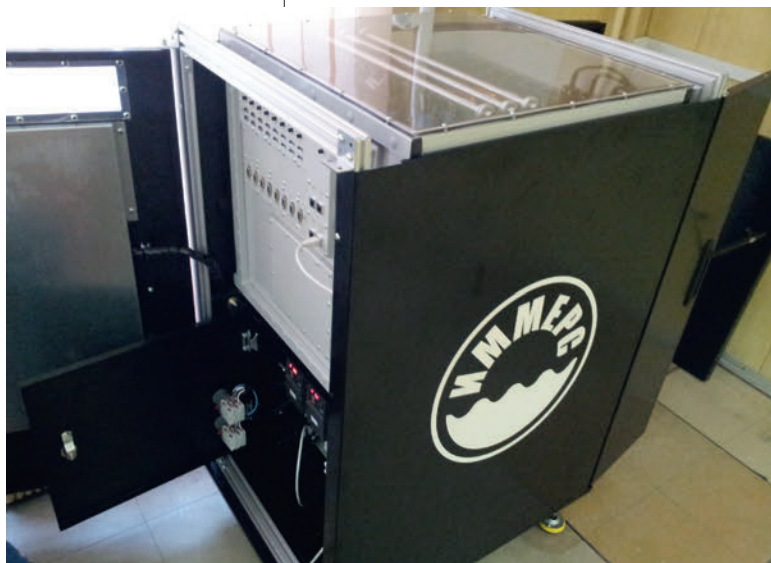
Рис. 2. Вычислительный комплекс IMMERS 8 R5 с погружной системой охлаждения

В России ведется строительство высокопроизводительных вычислительных центров, объектов информационной структуры в авиационной, судостроительной и других отраслях промышленности, спроектированных под жидкостные СО. Необслуживаемые жидкостные СО могут найти применение в бортовых вычислительных системах летательных, космических аппаратов, автономных станциях метеонаблюдения, навигации. Отечественные решения, разработанные под нужды наших заказчиков, обеспечивают снижение энергопотребления, уменьшение требуемой площади под инженерную инфраструктуру, увеличение производительности и срока службы компонентов, снижение производственного шума. ◆